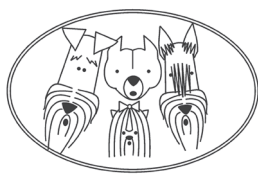
SLOVENSKI KLUB ZA TERIERJE